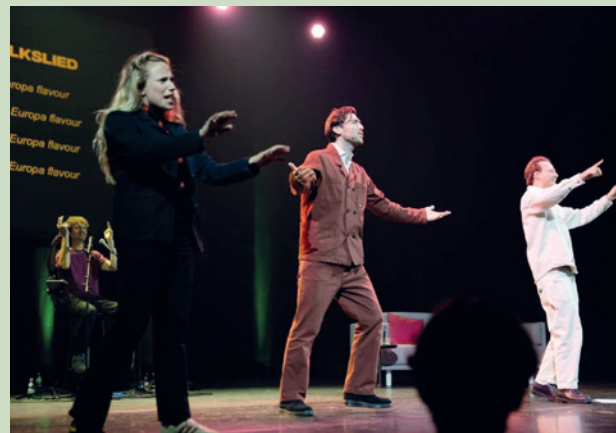
Beeld uit De Grote Europashow - De Kiesmannen