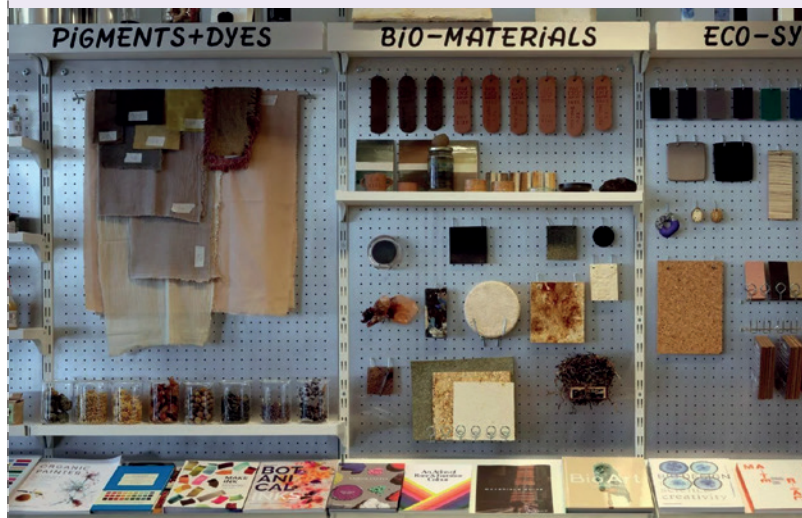
Het Future Materials Lab, een samenwerking tussen de Jan van Eyck Academie (Maastricht) en Central Saint Martins (Londen)

Het is eigenlijk zo dat het initiatief voor discipline-overstijgende samenwerking altijd moet komen van de wetenschappelijke kant. Die heeft toegang tot NWO-gelden. De alsmat groeiende groep artistic researchers, al dan niet met een PhD, staat altijd voor een dichte deur en voelt zich opgeleid voor een werkveld dat niet wordt erkend en daardoor aanvoelt als non-existent.”