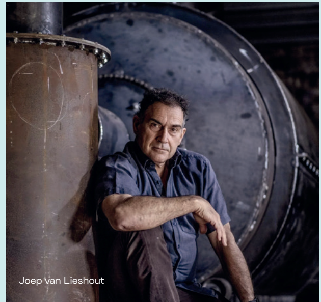
Joep van Lieshout

Joep van Lieshout is een bouwer van alternatieve werelden die vaak een extreme versie zijn van de werkelijkheid. Zo is Slave City een consequent doorgedacht systeem waarin de individuele mens ondergeschikt is gemaakt aan efficiënte productieprocessen en niet meer is dan grondstof. Zijn nieuwste werk, Disco Inferno , is een petrochemische mallemol die de waanzin van onze energieconsumptie blootlegt.